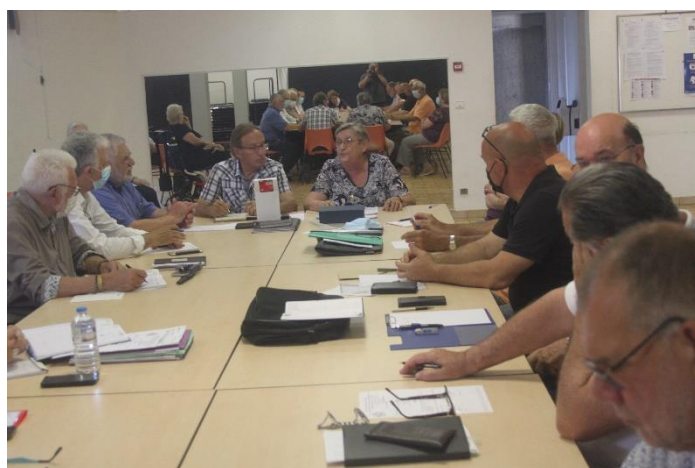
Le Comité Directeur de l'Hérault de la FFMJSEA au travail !

Prochaine réunion du comité : lundi 20 septembre à POUSSAN à 18h.